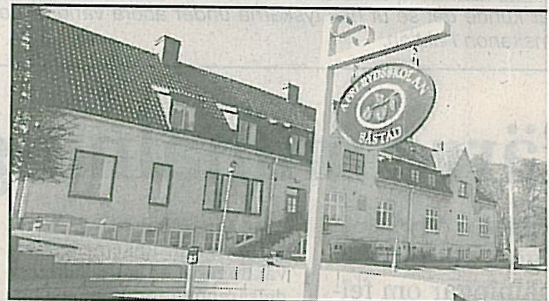
Apelrydsskolan har trivsel inbyggd i både de nya och gamla väggarna. Trädgårdsskolan blev lanthushållsskola, och i slutet av 90-talet återuppstätt som fristående gymnasieskola.

- Vi har redan grunden i andra program, som Kost, hälsa, idrott.