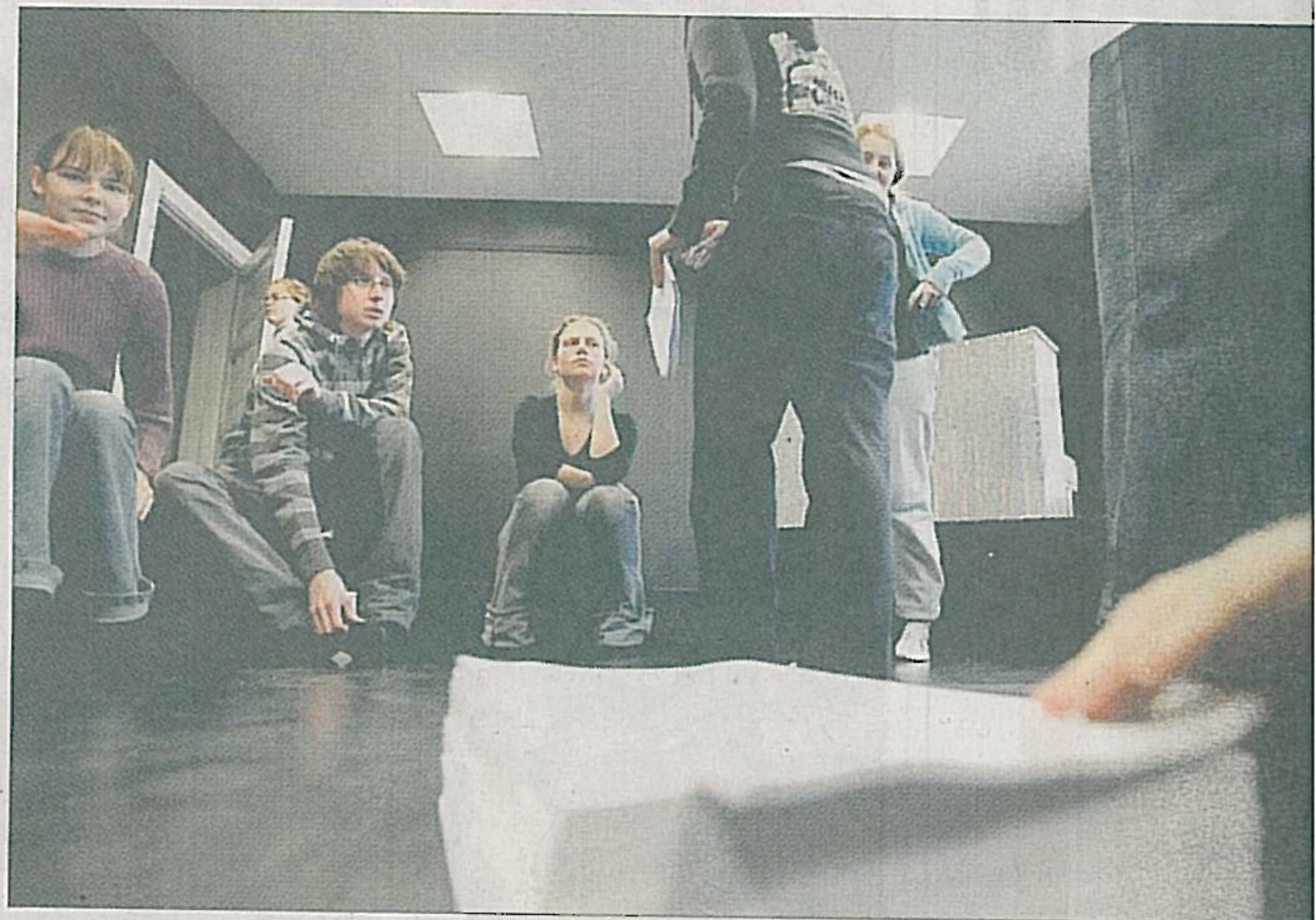
Dags för manuskäring. För att bli mer insatta i pjäsen får eleverna läsa den innan de ser den.

Pjäsen handlar om en kvinna som begick självmord vil-