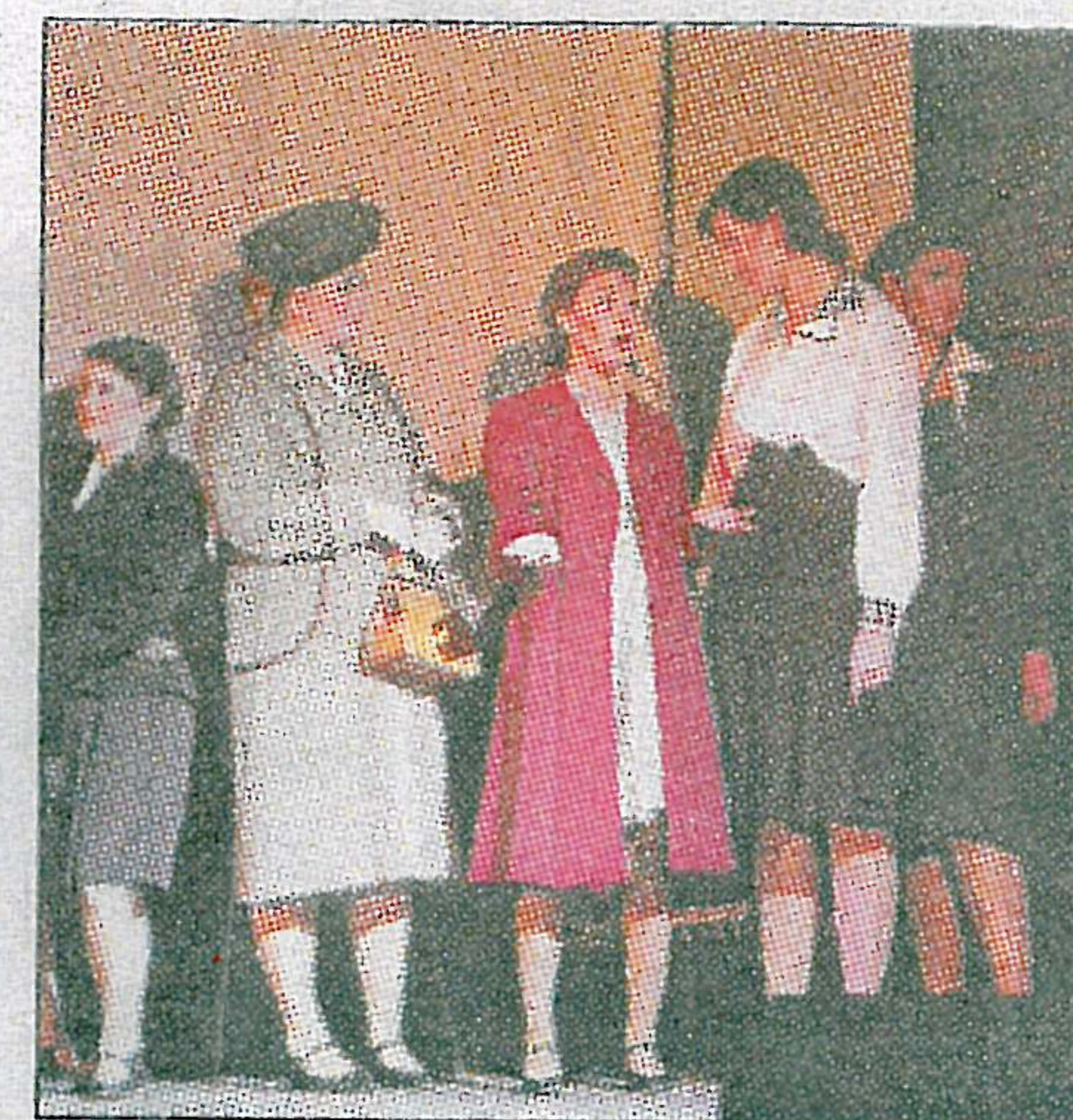
Eleverna på Apelrydsskolan visade på torsdagen upp sitt examensarbete i form av en alldeles egen musikal.