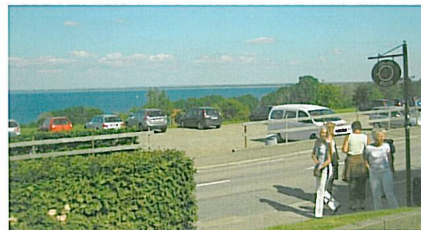
På skolan med Sveriges bästa utsikt går omkring 200 gymnasieelever i år.